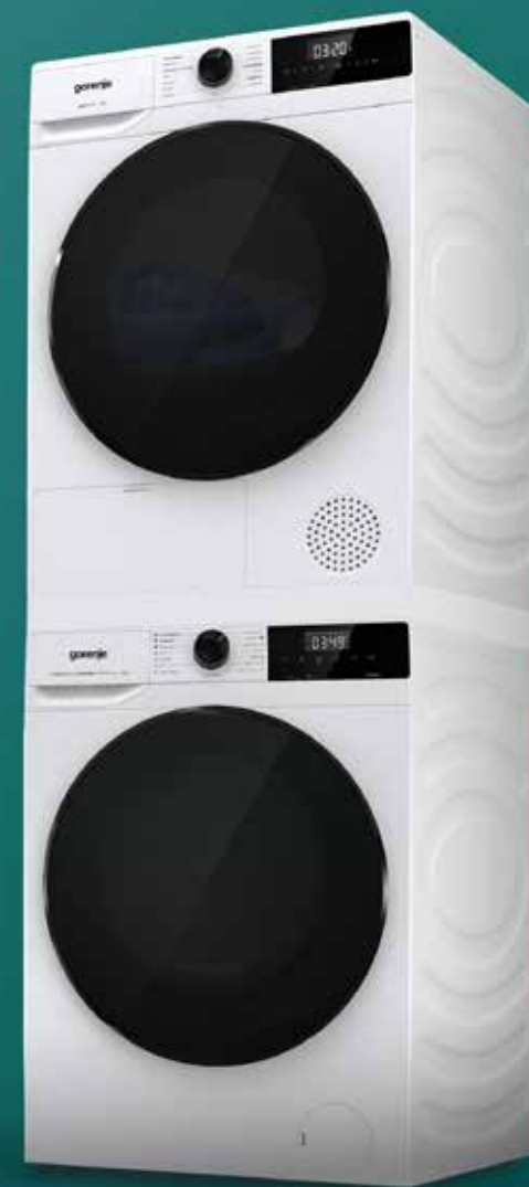
Łącznik pralki z suszarką SKHNE80W/PL